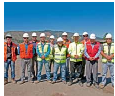
Nuestra Gente de la Obra Chiguayante-Hualqui

“El adjudicarse proyectos en Concepción, permite marcar presencia en la zona. En particular, las obras que a la fecha hemos ejecutado son importantes en términos del tamaño de los contratos y de los desafíos constructivos asociados a cada una de ellas. Para la Gerencia Regional de Concepción han sido fundamentales desde el punto de vista del posicionamiento en la zona y de la conformación de equipos que permitirán enfrentar los desafíos futuros”, explica.