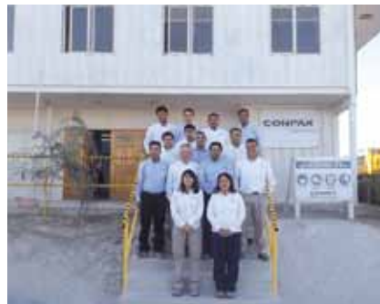
Equipo de colaboradores de Conpax Maquinarias de Calama

“...EL REFORZAMIENTO DEL PARQUE IMPLICÓ LA IMPLEMENTACIÓN DEL SISTEMA DE GESTIÓN INTEGRADO...”