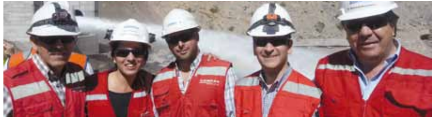
Equipo humano Obra Embalse el Yeso

Grupo Conpax siempre ha buscado diversos métodos para mantener sus altos estándares de seguridad. Esto último se debe a la preocupación permanente que tienen su plana ejecutiva y sus colaboradores-desplegados en las variadas faenas en el norte, centro y sur del país- por hacer los trabajos en forma segura y consciente.