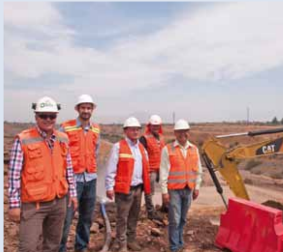
Grupo de colaboradores Obra de Metro, tramo 0 línea 6

Este contrato-el cual debe estar finalizado el 18 de abril de 2015- contempla la construcción de un pique rectangular en la Avenida Suiza de 15 metros de profundidad, desde el que se atacará el túnel 3 vías y túnel inter-estación. También es importante destacar que los futuros talleres a construir son de gran relevancia para Metro, ya que aquí los coches reciben su revisión mecánica para poder conseguir un óptimo funcionamiento.