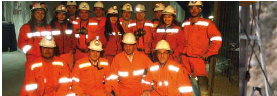
Equipo de colaboradores de Aura Ingeniería S.A.

En marzo del año 1999 ambas empresa forman el consorcio Aura-Conpax para ejecutar conjuntamente el proyecto Sistema de Ventilación en Mina Esmeralda, para División El Teniente de Codelco. Tras el positivo balance de este proyecto, se inició la sucesión de nuevos trabajos que día a día han contribuido cada día a estrechar los lazos entre ambas sociedades.